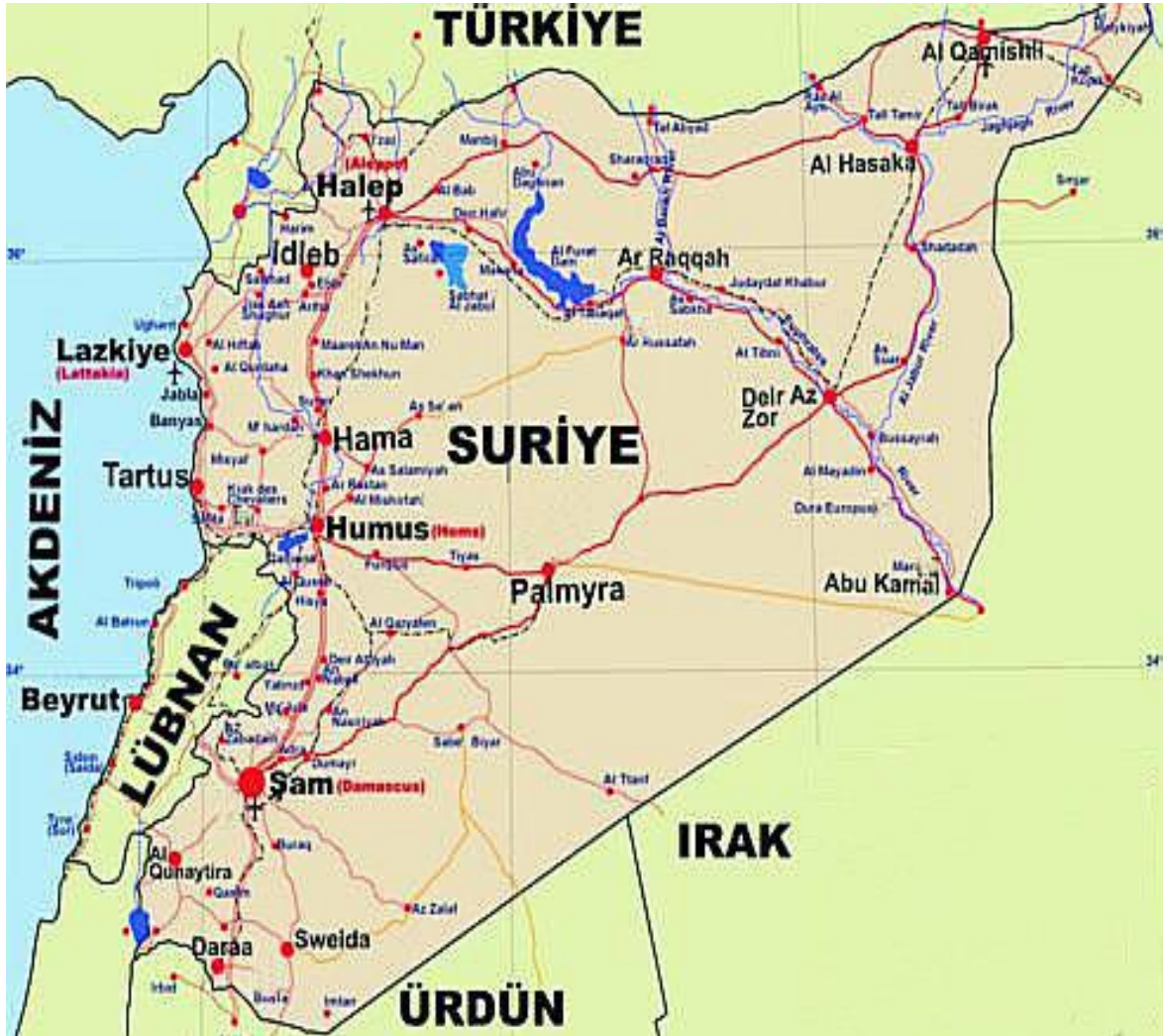
Harita 1: Suriye Arap Cumhuriyeti Haritası