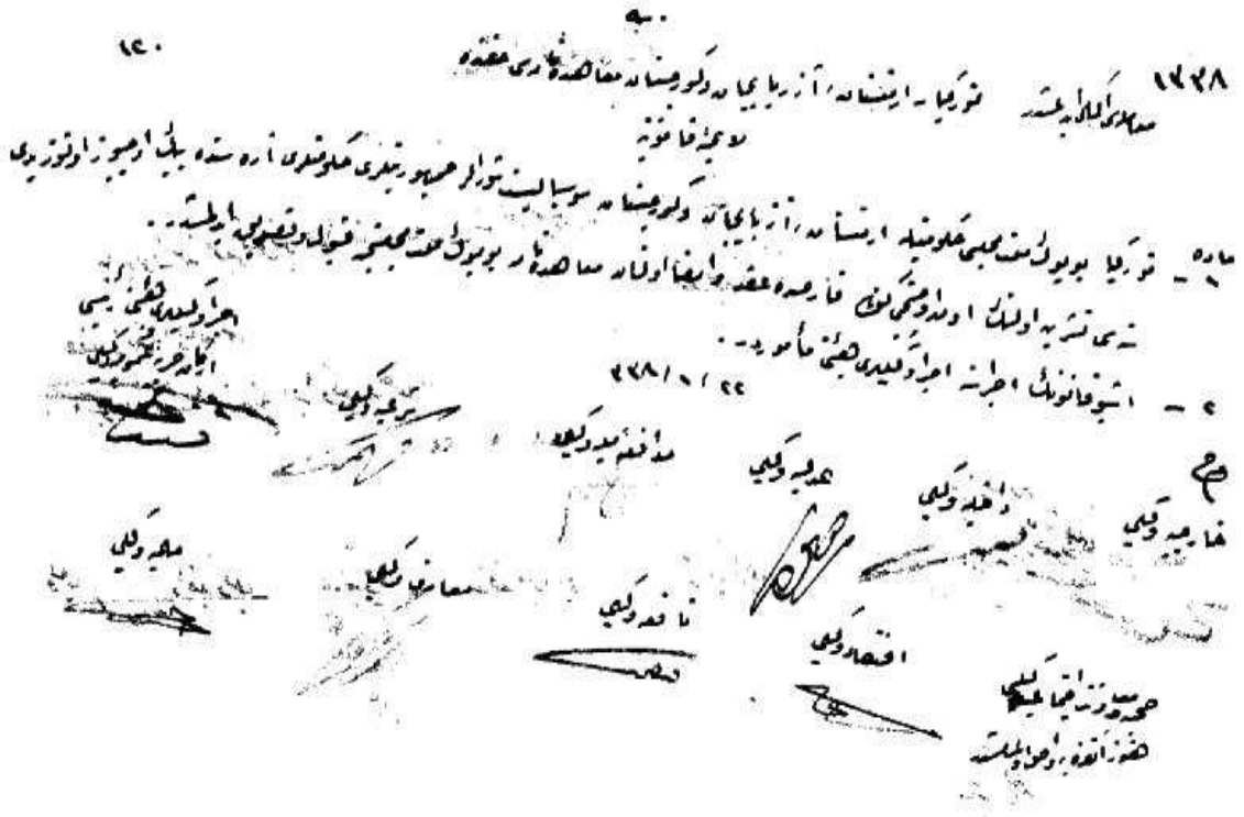
Belge-1: 13 Ekim 1921 tarihinde Ermenistan, Gürcistan ve Azerbaycan arasında imzalanan Kars Antlaşması'nın onayı (BCA.30.18.1.1./4.45.14).