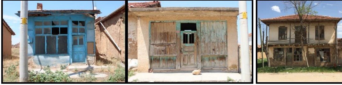
Şekil 8-9-10. Kadıkuyusu Köyü Dükkân Örnekleri (Kaynak: Merve Karaoğlu Can Fotoğraf Arşivi, 2017).

Köyün meydanı ve çevresinde, konutlara ulaşımın sağlandığı yollar üzerinde, çeşitli dükkân yapılarının olduğu görülmektedir. Bu yapıların çoğunluğu diğer yapılardan veya konutlardan bağımsız, tek katlı, tek odalı hacimler olarak inşa edilmiştir. Genellikle bir aks üzerinde konumlanan bu dükkânlar arasında, üst katları konut olarak işlevlendirilmiş olanlara da rastlanmaktadır (Şekil 8-9-10).