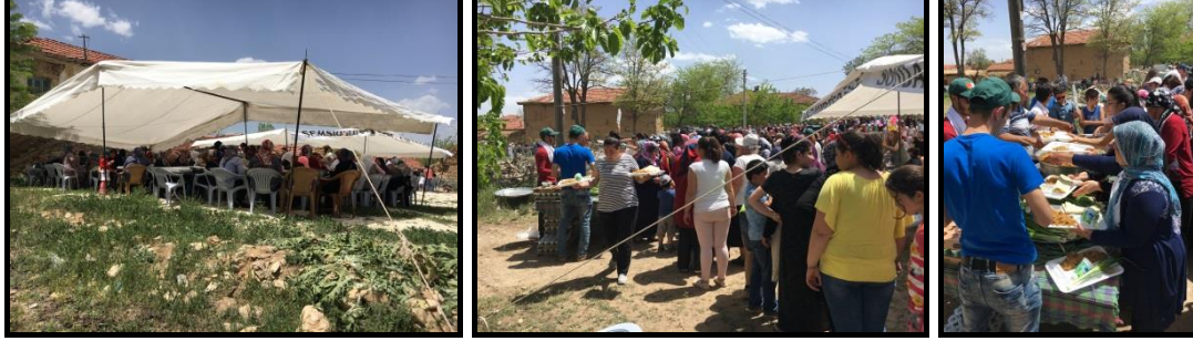
Şekil 5-6-7. Yağmur Duası Günü.

dağıtılır. Her yıl bir yardımsever, gücü yettiği ölçüde yemeğin tamamını ya da servis yapılacakların bir kısmını karşılamak isteyebilir. Senelerdir devam ettirilen bu gelenek ile birlikte, sosyal dayanışma ve yardımlaşma örneği sergilenir.