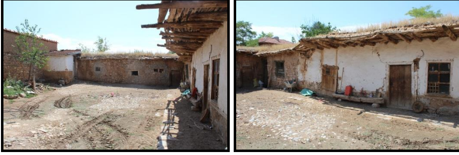
Şekil 22-23. Topkaya Ailesi Konutu- Bahçe ve 'Dam' Mekânları.