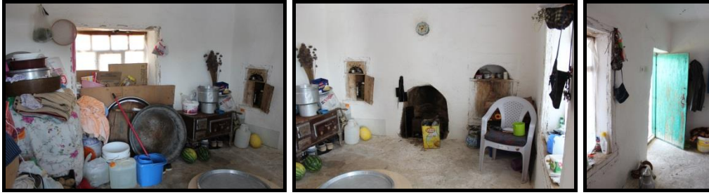
Şekil 32-33-34. Topkaya Ailesi Konutu-‘Yoğurt Damı’.