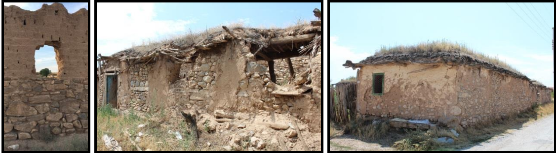
Şekil 11-12-13. Kadıkuyusu Köyü Yapı Örnekleri (Kaynak: Merve Karaoğlu Can Fotoğraf Arşivi, 2017).