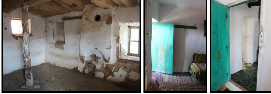
Şekil 26. Can Ailesi Konutu- Zemin Kat Toprak Malzemeli Mutfak Mekânı.