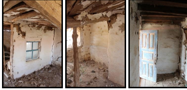
Şekil 35-36-37. Can Ailesi Konutu- Yaşama Mekânları.