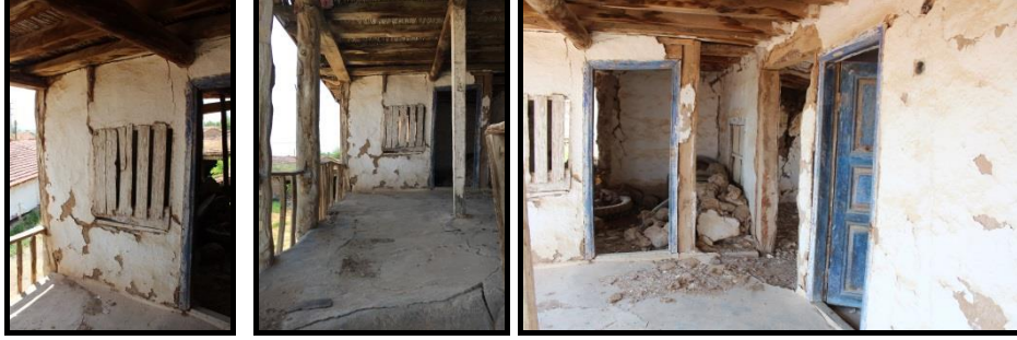
Şekil 29-30-31. Can Ailesi Konutu-‘Yoğurt Damı’ ve Diğer Odalarla İlişkisi.

damı denmesi sebebi de o odaya yoğurt tuluğu 19 asarlardı. Ama ambarımız orası değildi. Bizim ambarımız samanlığın içindeydi.’ Odaların, damların çok net bir işleve ait olmaması, iç mekân kurgularının yalınlaşmasını sağlarken, aynı zamanda ergonomik çözümlere önemli katkılar sağlamaktadır. Diğer bir deyişle, tek mekânın çeşitli eylemlere bu denli açık olması, farklı kullanıcılara –çocuktan yaşlıya- yönelik uygun ölçülerin göz önünde bulundurulduğu bir boyutsal düzeni beraberinde getirmektedir.