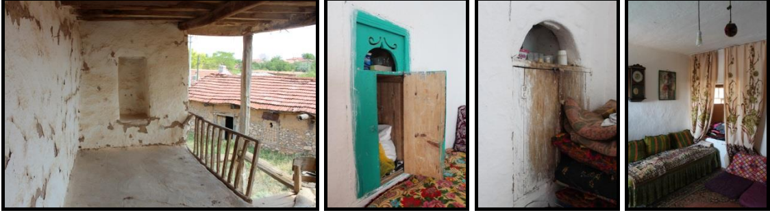
Şekil 41. Can Ailesi Konutu- Dış Sofa Tavalığı (Kaynak: Merve Karaoğlu Can Fotoğraf Arşivi, 2017).