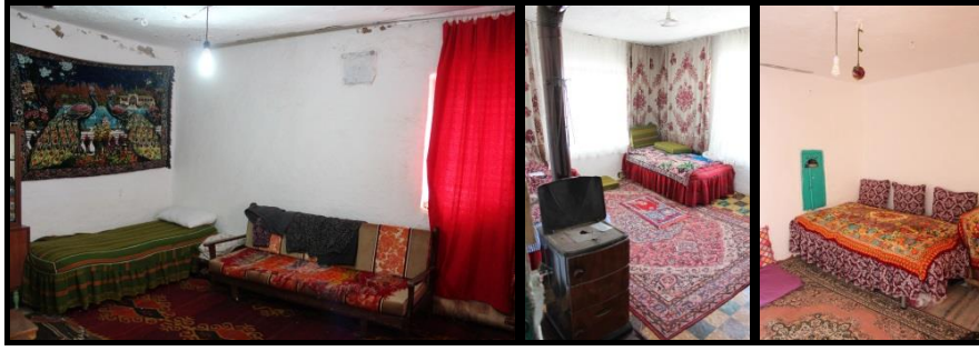
Şekil 38-39-40. Topkaya Ailesi Konutu- Yaşama Mekânları.

Konutların oda tasarımında pencerelerin üzerinde veya odayı çevreleyen duvarlarda herhangi bir şey koymak için kullanılan raflara rastlanmamıştır. Bunun yerine her odada ahşap işlemeli kapaklarla korunan küçük ölçekli dolaplar yapılmış veya örtü ile kapatılmış tanımlı boşluklar bırakılmıştır. Bu boşlukların çoğunluğu yatak-yorganın istiflendiği yüklüklerdir. Saklama- depolama kültürünün farklılık gösterdiği noktada daha belirgin bir şekilde görülmektedir. Yapılan görüşmelerde de, incelemelerde anlaşıldığı üzere kıyafet dolabı olarak kullanılan bir eleman ya da tasarlanmış bir boşluk bulunmamaktadır. Geleneksel konut yapım sürecine dâhil edilmeyen bu ihtiyaçlar için sonradan ekleme seleler, duvar kalınlığının pencere önlerinde ortaya çıkardığı derinlikler veya duvar yüzeyindeki bir takım nişler değerlendirilmektedir. Fadime Yersel (46); 'Yüklüklerimiz oluyordu yatak yorgan koyalım diye. Biraz dardı, küçüktü onlar ama biz yine de koyardık içine eşyalarımızı, perde takıyorduk önüne. Kanaviçeli, dantelli beyaz işleri de çamaşırlarımızı koyduğumuz tavalıkların önüne asıyorduk. Daha da yer yetmezse ahşap örgü sepetlerimiz vardı onun içine koyup da kaldırıyorduk. Benim çocukluğumda köye hususi sepetçiler gelirdi, onlardan alırdık.' Fadime Yersel ile yapılan görüşmede bahsi geçen tavalıkların saklanacak başka malzeme yok ise çamaşırlık olarak kullanıldığı dikkat çekmektedir.