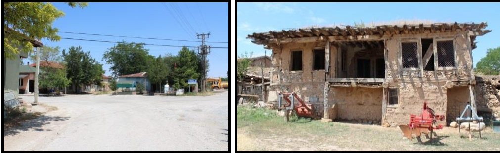
Şekil 3. Kadıkuyusu Köy Meydanı (Kaynak: Merve Karaoğlu Can Fotoğraf Arşivi, 2017).