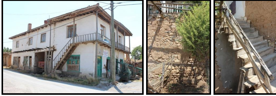
Şekil 17-18-19. Topkaya Ailesi Konutu- Yapı Detayları (Kaynak: Merve Karaoğlu Can Fotoğraf Arşivi, 2017).

Geleneksel yapıların bölgeye dağılımında komşuluk ilişkileri önemli bir yer tutmaktadır. Mahremiyetin ve herkesin manzaraya sahip olabileceği hakkının korunduğu il-ilçe-köy yerleşimlerinde eğer coğrafi bir kısıtlama yoksa seyrek yapılaşma görülebilmektedir. Kadıkuyusu Köyü bu örneklerden biridir. Bölgede yazları havanın sıcak ve kuru olması, tarımsal faaliyetlerin evlerin bahçelerinde devam ettirilmesi, yapı sınırlarının belirleyicileri arasındadır. Fadime Yersel (46); 'Bizim evimizin önünde düvenle harman sürülürdü, o yüzden bahçemiz büyüktü. Taneler birbirinde ayrılınca eleklerle elenirdi, yunnağa 17 götürürlerdi, değirmenlikse kışlık ihtiyacı karşılayacak kadar un yapıyorlardı bendeklere 18 doldurulurdu un evinin köşesine koyardık. Onu bir yıl yerdik. Satılacakları ambara koyardık, tohumlukları, koyunların, ineklerin, köpeklerin yediklerini ayırırdık. Üzüm kuruturduk, yoğurt yayardık, tereyağımızı, pekmezimizi yapardık. Her şeyimizi kendimiz yapardık, dışardan kolay kolay bir şey satın almak yoktu.' Bölgenin doğal koşulları sonucu gelişen üretim biçimleri, bahçenin tasarım kriterlerini doğrudan etkilemektedir. Sıradan bir evin bahçesinde gerçekleşen bu üretim eylemleri sebebiyle, inşa edilecek mekânların başlıcaları Ramazan Yersel (54)'in verdiği bilgilere göre; 'öküzlük (inek damı), koyun damı, samanlık, ambar (arpa, buğday, kavun saklanır), tavuk damı, un damı, katık (poyraz) damı, kuyu ve tuvalet' tir.