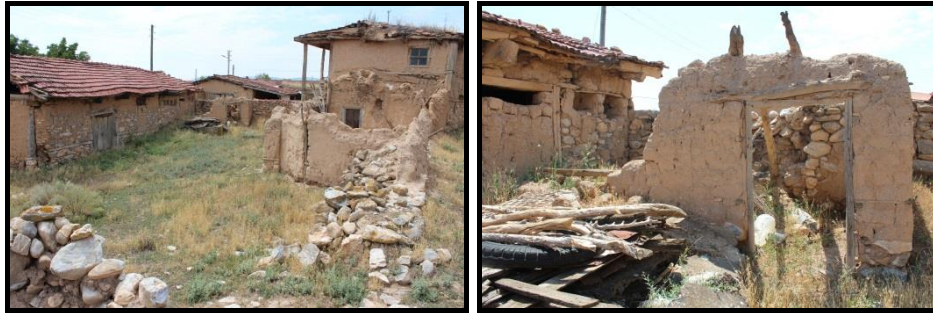
Şekil 20-21. Can Ailesi Konutu- Bahçe ve 'Dam' Mekânları (Kaynak: Merve Karaoğlu Can Fotoğraf Arşivi, 2017).

Geleneksel yapıların bölgeye dağılımında komşuluk ilişkileri önemli bir yer tutmaktadır. Mahremiyetin ve herkesin manzaraya sahip olabileceği hakkının korunduğu il-ilçe-köy yerleşimlerinde eğer coğrafi bir kısıtlama yoksa seyrek yapılaşma görülebilmektedir. Kadıkuyusu Köyü bu örneklerden biridir. Bölgede yazları havanın sıcak ve kuru olması, tarımsal faaliyetlerin evlerin bahçelerinde devam ettirilmesi, yapı sınırlarının belirleyicileri arasındadır. Fadime Yersel (46); 'Bizim evimizin önünde düvenle harman sürülürdü, o yüzden bahçemiz büyüktü. Taneler birbirinde ayrılınca eleklerle elenirdi, yunnağa 17 götürürlerdi, değirmenlikse kışlık ihtiyacı karşılayacak kadar un yapıyorlardı bendeklere 18 doldurulurdu un evinin köşesine koyardık. Onu bir yıl yerdik. Satılacakları ambara koyardık, tohumlukları, koyunların, ineklerin, köpeklerin yediklerini ayırırdık. Üzüm kuruturduk, yoğurt yayardık, tereyağımızı, pekmezimizi yapardık. Her şeyimizi kendimiz yapardık, dışardan kolay kolay bir şey satın almak yoktu.' Bölgenin doğal koşulları sonucu gelişen üretim biçimleri, bahçenin tasarım kriterlerini doğrudan etkilemektedir. Sıradan bir evin bahçesinde gerçekleşen bu üretim eylemleri sebebiyle, inşa edilecek mekânların başlıcaları Ramazan Yersel (54)'in verdiği bilgilere göre; 'öküzlük (inek damı), koyun damı, samanlık, ambar (arpa, buğday, kavun saklanır), tavuk damı, un damı, katık (poyraz) damı, kuyu ve tuvalet' tir.