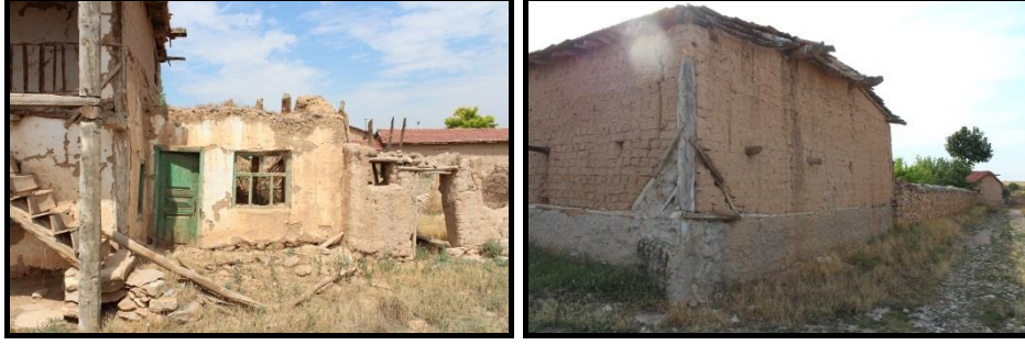
Şekil 24. Can Ailesi Konutu- Yapıya Ek Misafir Odası.