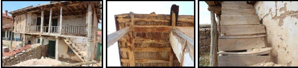
Şekil 14-15-16. Can Ailesi Konutu- Yapı Detayları.