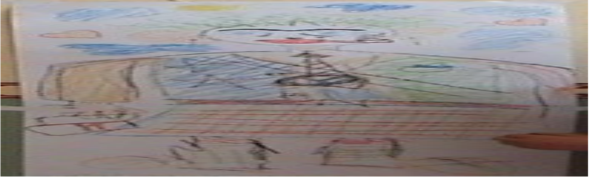
Figür 2. Şukufe Lületek

Üçüncü insan figürü: “Safiye Topçu ” adında bir karakter;19 yaşında Ankara Sincan’da yaşayan kütüğü Diyarbakırlı olan cinsiyetsiz (türünün tek örneği), kayın validesi tarafından ezilen bir Anadolu kızı. Bu genç kadın babası öldükten sonra Ankara’da yaşayan dayısının yanına annesiyle göç etmiş ve dayısının dolmuşunda çalışmaya başlamış ve dolmuşta tecavüze uğradıktan sonra gazinoda çalışmaya başlayan bir kadın tiplmesi yaratılmıştır.