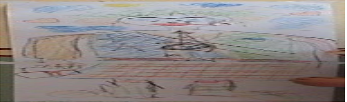
Figür 3. Safiye Topçu

Üçüncü insan figürü: “Safiye Topçu ” adında bir karakter;19 yaşında Ankara Sincan’da yaşayan kütüğü Diyarbakırlı olan cinsiyetsiz (türünün tek örneği), kayın validesi tarafından ezilen bir Anadolu kızı. Bu genç kadın babası öldükten sonra Ankara’da yaşayan dayısının yanına annesiyle göç etmiş ve dayısının dolmuşunda çalışmaya başlamış ve dolmuşta tecavüze uğradıktan sonra gazinoda çalışmaya başlayan bir kadın tiplmesi yaratılmıştır.