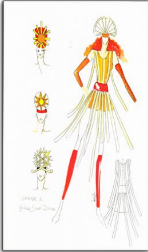
Tasarım 6 Güneş Dansı Kostümü

Günümüze kadar ulaşan en eski güneş saati Mısırlılara aittir. Kostüm, Güneş ışınlarının bir cisimde meydana getirdiği gölgelerden faydalanarak günün kısımlarını bulan düzenekten yola çıkarak hazırlanmıştır.