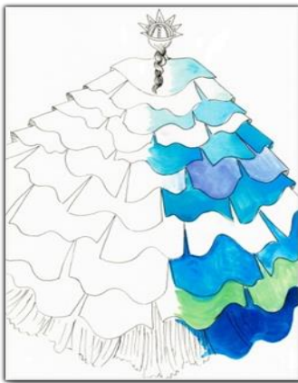
Tasarım 2 Tufan Dansı Kostümü

Tufan dansı kostümünün pelerinde deniz renkleri olan mavi tonları kullanılmıştır.