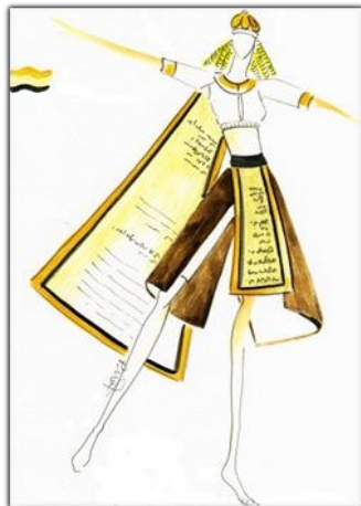
Tasarım 5 Tabletler Dansı Kostümü

Giysiye uygun hazırlanan başlık dikkat çekici ve çarpıcıdır. Tayt ve parçalı bütünden oluşan kostümde, takvim üzerindeki yazılar parlak renklerle yazılmıştır.