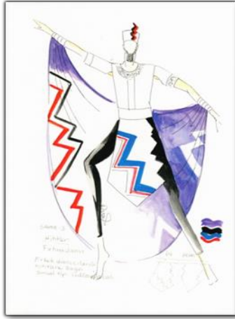
Tasarım 3 Fırtına Dansı Kostümü

Hitit kaya kabartmalarından esinlenerek erkek dansçılar için hazırlanan kostümün başlığı sakallı çalışılmıştır.