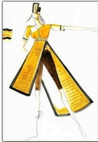
Tasarım 4 Takvim Dansı Kostümü

Dansın sert hareketlerindeki fırtına hissi, dairesel pelerinle sağlanmıştır. Siyah tayt üstündeki ön ve arka etek parçaları, geometrik desenlerle süslenerek tema ile bütünlük sağlanmıştır.