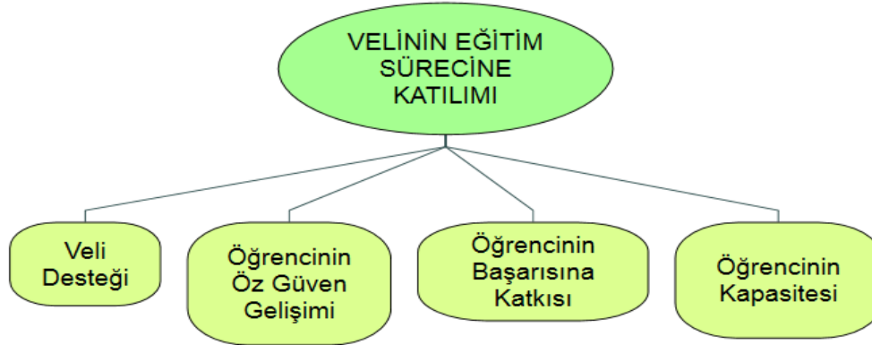
Şekil 3. Velinin eğitim sürecine katılımı

Görüşme yapılan velilerin velinin eğitim sürecine katılımı temasına ilişkin görüşlerinden bazıları şöyledir;