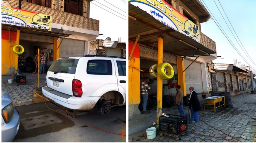
الصورة (13) تصليح إطارات السيارات في حي الزهراء في مدينة الصويرة لعام (2021)