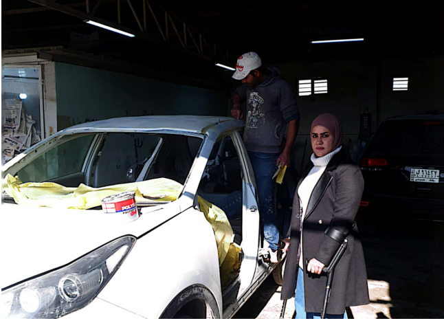
الصورة (12) سمكرة وصيغ السيارات في الحي في الصناعي مدينة الصويرة