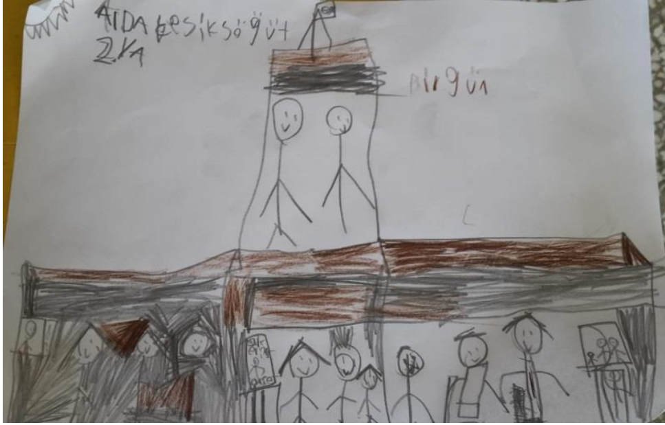
Resim 1. 8 yaşında bir erkek çocuğu resmi

Çocuğun çizdiği resimle çocuk arasında ruhsal bir ilişkinin varlığı birçok uzman tarafından ileri sürülmüştür. Bu nedenle çizilen resim üzerinden göstergelere dayalı okumalar ve yorumlar çocuğun yaşantı içeriğine ait bilgilerle desteklendiğinde çocuğun içsel yansımaları anlamamıza ve anlamlandırmamıza büyük katkılar sağlayabilmektedir. Çocukların çizdikleri resimler yoluyla psikolojik durumlarının tespitine yönelik çalışmalar gün geçtikçe artmaktadır. Türkiye’de diğer ülkelere göre yeterince çalışma yapılmadığı görülmüştür. Başta Amerika olmak üzere Batılı birçok ülkede bu türden çalışmalar giderek ağırlık kazanmaktadır. Yapılan araştırmada, belirli yaş grubundan seçilen çocuk resimlerinde görülen bilinçaltı problemlerin bilinçdışına çizim yoluyla nasıl yansıdığı, yaşantı içeriğinden edinilen bilgilerle de desteklenerek hermeneutik kuramı aracılığıyla tespit edilmeye çalışılmıştır.