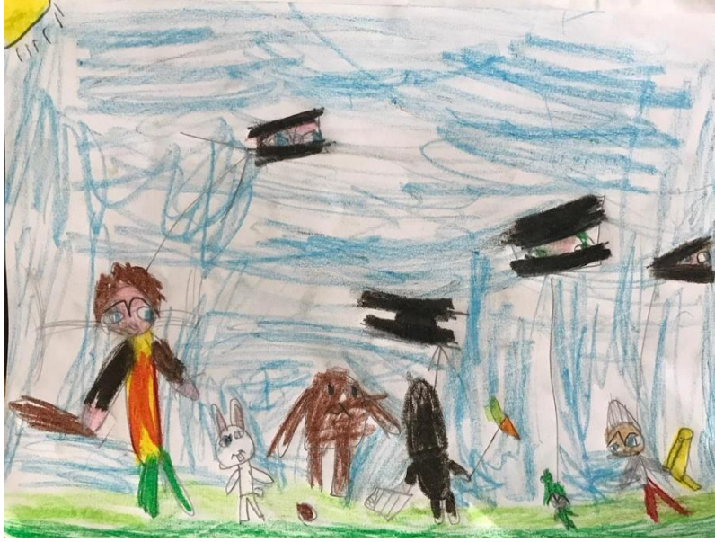
Resim 2. 10 yaşında bir erkek çocuğu resmi

dönemde Çöp adam, ego sisteminin yaşa göre zayıf olduğunu gösterir”. Resim yüzeyinde yer alan çizgi değerleri ve şiddeti de çocuktaki duygu durum bozukluğunu göstermektedir. Venger’in (2003) yaptığı araştırmaya göre depresif durumların belirtisi olarak kullanılan renklerin kahverengi, gri ve siyah olduğu belirtilmiştir. Renk kullanımındaki azlık ve renk seçimleri de bu yaklaşımı desteklemektedir. Çocuğun derslerdeki başarısını ve arkadaşları ile iletişimini olumsuz etkileyen bu süreç, çocukta içe kapanık bir ruh hali ve iletişim kuramama gibi olumsuzlukları da tetiklemektedir. Yine çocuğun kendi tanımlamasından bilindiği üzere, aile birlikteliğinin dağılması sonucunda içinde bulunduğu ortamdan çıkarımda bulunarak yapmış olduğu resim, parçalanmış ailelerde yetişen çocukların karmaşık ruh halini etkili bir biçimde yansıtmaktadır.