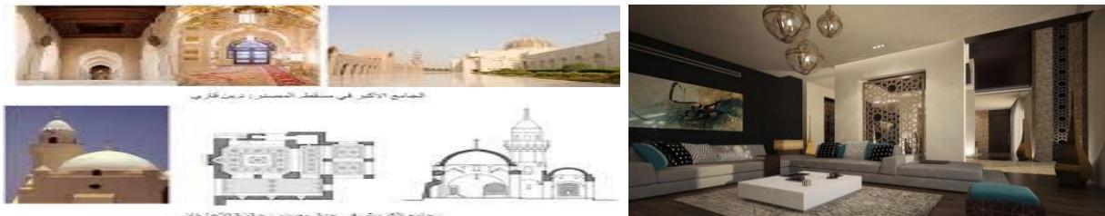
شكل رقم (2-4)

2. إتزان غير متماثل: ويتم من خلاله الموازنة بين عناصر متساوية ولكنها غير متطابقة. كما في الشكل (2-4)