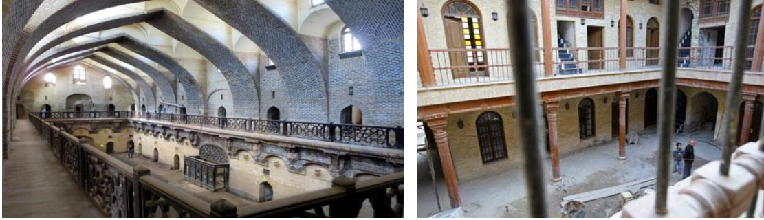
الحوش البغدادي شكل (1-2) خان مرجان

الفضاء ان يوضحان تصميم الفراغ كوحدة كلية تتولد منها الاجزاء الاصغر