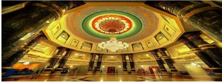
شكل (1-4) صورة بنورامية لبهو قصر الفاو يوضح البهو مع الأعمدة المزدوجة والقبة وتفصيلاتها