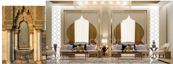
شكل رقم ( 2-3 )

يعد الإتزان والاستقرار من أهم الأسس التي اتبعت في الفنون الإسلامية حيث نستطيع أن نراه في العمارة الإسلامية وفي القباب وفي التكوينات الزخرفية، ويتحقق الإتزان من خلال استقرار التكوين حول محور ثابت في منتصفه فهو يهتم بالتعادل البصري لعناصر التكوين. ويعد الإتزان من أهم الأسس التصميمية المعاصرة فالتصميمات المتزنة تبدو مستقرة ومريحة للعين حيث يعمل الإتزان في التصميم الداخلي على ترتيب العناصر داخل الفراغ ليعطي الاحساس بالراحة، ويقسم الإتزان إلى ثلاثة أنواع (احمد، 2007:ص14): 1. إتزان متماثل: يتم من خلاله ترتيب العناصر المتشابهة على محور بصري بصورة متطابقة، كما في الشكل (2-3).