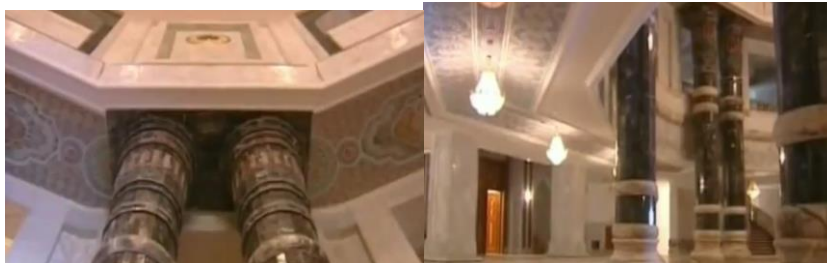
شكل (2-4) يوضح الأعمدة المزدوجة والنقوش الزخرفية السقفية والمساحات خلف الأعمدة