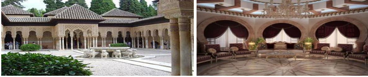
شكل رقم (2-5)

- اتزان ديناميكي: هو احد انواع الإتزان غير المتماثل ولكنه يحرك عين المشاهد في كامل الفراغ. كما في الشكل (2-5)