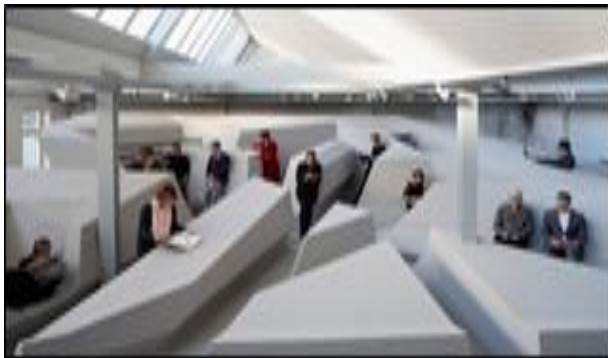
شكل رقم (2-7) التعقيد في العناصر التكوينية والتأثيثية

التعامل مع الشكل في حركة ما بعد الحداثة كان بالضد من مفهوم الشكل في الحداثة. فقد تحولت الخطوط الواضحة المستقيمة والبساطة الشكلية إلى مفاهيم شكلية جديدة تحكمها مبادئ التعقيد، الانتقاء، الكلاسيكية، الزخرفة، التعددية، والرمزية. وترى المفردات التكوينية للشكل على أنها وسيلة لإبراز المعاني الرمزية التي تمثل حاجة إنسانية فطرية (الامام, 2003, ص33-34). وتحدث حالة التعقيد متى ما يمر النظام بتغيرات غير ثابتة ولا نظامية بمرور الوقت ويصبح السلوك المستقبلي غير متوقع للنظام. وإن ظواهر التعقيد من الظواهر الطبيعية التي تشكل النظام الكامل بالرغم من بيان عدم الثبات (الشك), وعدم القدرة على التنبؤ (اللاتنبؤية), وكذلك الفوضى, إلا أنه أصبح تمثيل التعقيد يُعد سمة محتومة وحقيقية تمثل ضرورة للتطور الذي نعيشه فقد أصبح المنهج الاساس لطرائق التفكير بدلاً من الخطية والتنبؤية غير الملائمة تحت أي ظرف من الظروف (بيمان, 2006, ص39). وبهذا فإن العلاقة بين الشكل والمضمون لصيقة وثابتة إلا أنه بالإمكان زعزعة تلك العلاقة عبر تحميل الشكل أكثر من معنى وإحجائه عن مضمونه بإزاحة العلاقات المرادفة بين الدال والمدلول لتكوين دلالات عدة ومنفتحة الاحتمالات. ومن هذا الباب تعاملت حركة ما بعد الحداثة مع الشكل ومعناه (كان بالضد من مفهوم الشكل في الحداثة) عبر توظيف عدد من المبادئ الجمالية والأنظمة التقنية والجمع بين الحديث والقديم في البنى الشكلية للمفردات التكوينية. فقد تحولت الخطوط الواضحة المستقيمة والبساطة الشكلية إلى مفاهيم شكلية جديدة تحكمها مبادئ التعقيد، الانتقاء، الكلاسيكية، الزخرفة، التعددية، والرمزية.