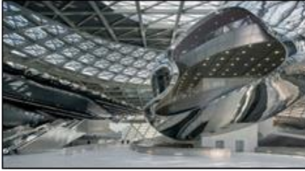
شكل رقم (2-8) مستويات متقدمة من التعقيد

هيكل واحد, ويقصد به استشارة انتباه المتلقي عبر قوى الفعل ورد الفعل التي تحدثها بين الشكل وخلفيته والشكل والأشكال المجاورة.