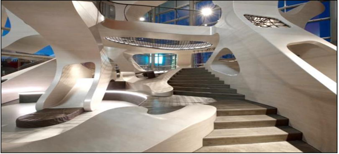
شكل رقم (1-2) التعقيد في التصميم الداخلي

لذا فإن بغية التصميم الداخلي على المستوى البصري للعناصر هي تحقيق هيئات وقيم شكلية مبتكرة وبصفات عصرية ومتجددة عبر الاستعاضة عن القديمة منها وإحلال أنساق جديدة بصيغ أكثر تحرراً، وبمستويات لا تدرك الفوضى من جهة ولا الرتابة والملل من جهة أخرى، ضمن بيئة غنية ومتنوعة الأشكال والهيئات فتقود بذلك إلى تأسيس فضاءً رحباً من الاحتمالات الإدراكية والمعلومات المتجددة، والتي تثري بدورها عنصري المفاجئة والغرابة وبشكل يؤدي إلى الإثارة والتشويق. وقد عمد مصممي الحدائث إلى إزالة الشكل المعقد من البيئة الداخلية والمعمارية، فحضور الانماط الهندسية المتكررة أصبح غير مرغوب فيه لأن الشكل الجديد يأخذ مستوى واحداً من القياس، مثال تركيب يحوي بضمنه تراكيب ثانوية (وبذلك يحقق التعقيد)، إلا أن بعض التصميمات خرجت عن هذه القاعدة في محاولة للتمييز عن الأشكال الطبيعية وأساليب البناء التقليدية. وفي نهاية فترة الحدائث عمد المصممون إلى توظيف التكرار كآلية لتوظيف المعلومات حتى وإن لم يكن محتوى فيها، إلا أنها اتسمت بالتنظيم الجيد. فالتكرار لا يؤدي بالضرورة لخلق انماط جديدة. ثم جاءت عمارة ما بعد الحدائث، فالمصممون هنا ردوا على الطراز الدولي للمباني وفضاءاتها الداخلية