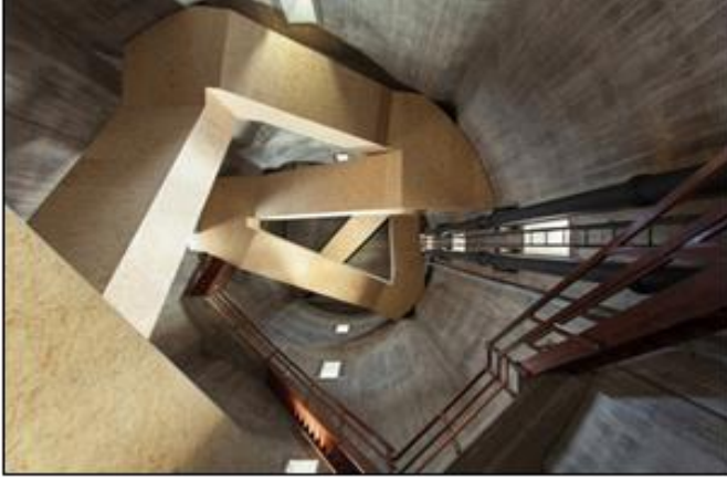
شكل رقم (2-9) الغموض في مشهد الفضاء الداخلي

استعمال الأشكال الى درجة استهلاكها قد تؤدي الى فقدان معناها واكتسابها دلالات جديدة، وهذا يجعل المنظومة التعبيرية والجمالية للتصميم الداخلي في حالة تغير مستمر، كما أن ترابط المدلولات قد يثري الهيكل الداخلي للمعنى مما يؤدي الى قراءات مختلفة إذ يعاد تفسير الناتج مرة بعد أخرى من قبل مشاهدين جدد.