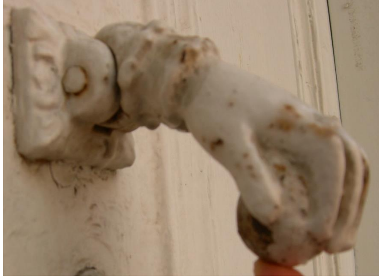
Fotoğraf:14 (Edirne Etnografya ve Arkeoloji Müzesi) -15 El şeklinde kapı tokmakları

4.2.4.Oval Şekilli Kapı Tokmakları: Bu gruba giren kapı tokmakları genellikle döküm tekniğinde yapılmışlardır. Malzeme olarak tunç kullanılmıştır. Bu biçimli tokmakların Avrupa kökenli olduğu düşünülmektedir. Fakat yakın zamana kadar Tokat'ta üretimi yapılmakta idi.