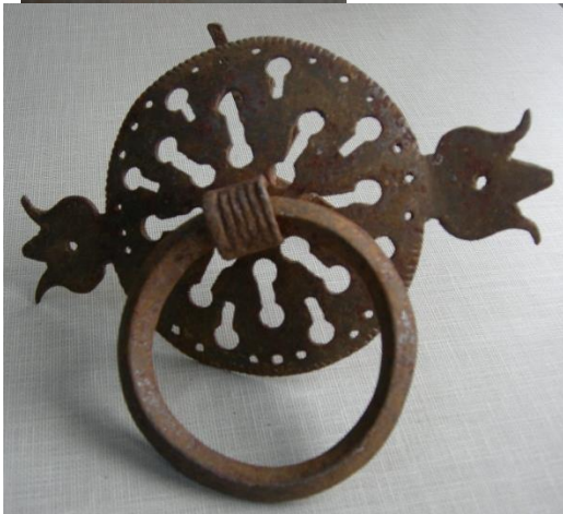
Fotoğraf: 8-9-10-11-12-13 Bitkisel şekilli kapı tokmakları

4.2.3. İnsan Eli Şekilli Kapı Tokmakları: Prehistorik dönemlerden başlayarak el mağara duvarlarına kazıma ve boyama şeklinde görülmektedir. Beş parmağın Hz.