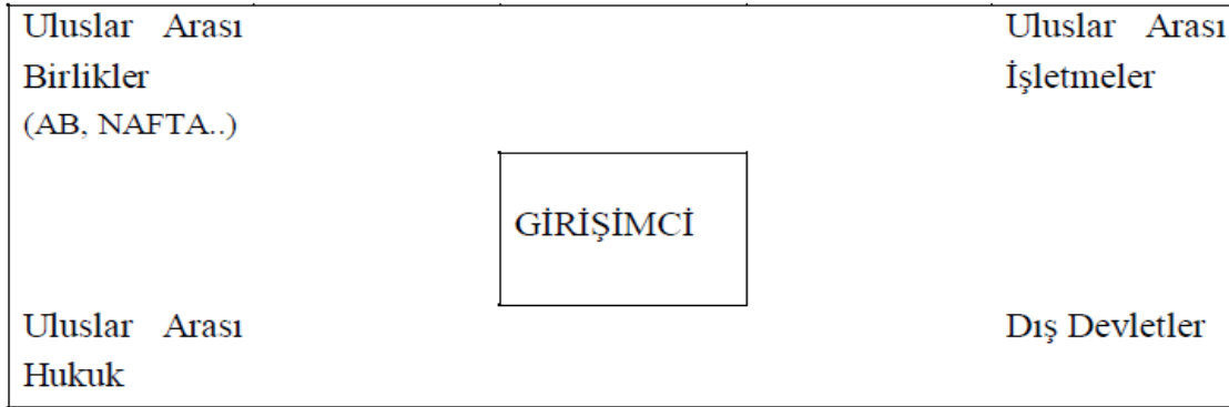
Şekil 3: Girişimcinin Uluslararası Çevresi