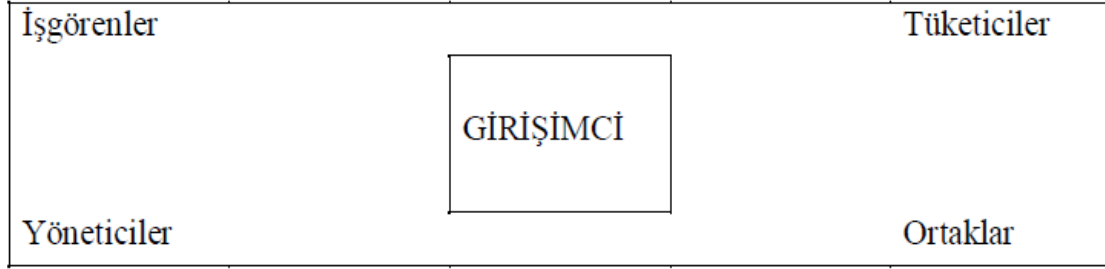
Şekil 1: Girişimcinin Yerel Çevresi