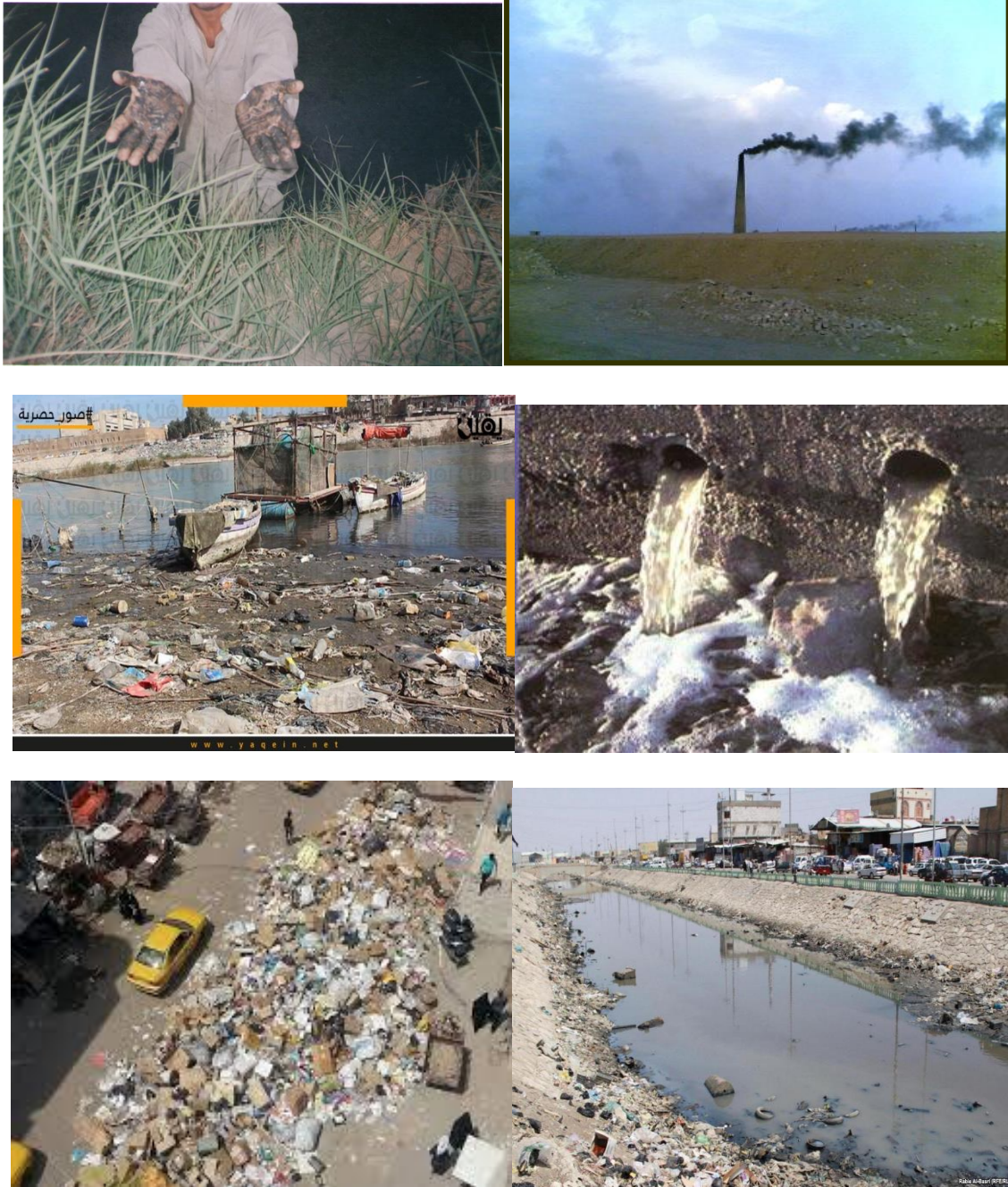
شكل رقم ( 1 ) انواع من التلوث في العراق

بصورة عامة تعد المعادن الثقيلة والتي تتمثل بـ( الزئبق ، الحديد ، المنغنيز ، الزنك ، النحاس ، الخاصين ، الزنك ، الرصاص ، الكاديوم ، الباريوم ، الفناديوم ، القصدير وغيرها ) من اخطر تلك