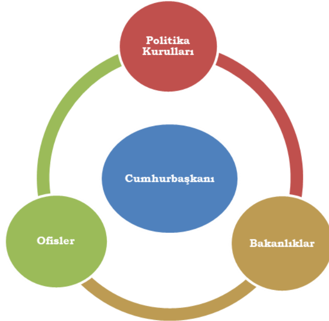
Şekil 1. Cumhurbaşkanlığı Hükümet Sistemi Yapılanması

Şekil 2'de Cumhurbaşkanı etrafında şekillenen teşkilat yapısının politika oluşturma süreci açısından sıralamasına yer verilmiştir. Politika oluşturma sürecinde; ofisler politika hazırlama, politika kurulları politika geliştirme ya da oluşturma, bakanlıklar