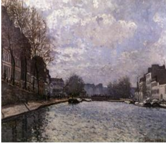
Görsel 4: Alfred Sisley, Saint Martin Kanalı'ndan Görünüm, 1870, tuval üzerine yağlıboya, 50 x 65 cm, Musée d'Orsay, Paris, Fransa.