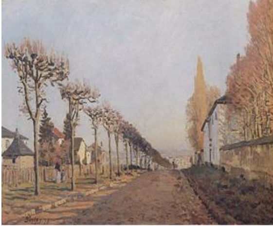
Görsel 6: Alfred Sisley, Sevres yolu, 1873, tuval üzerine yağlıboya, 54 x 73 cm, Musée d'Orsay, Paris, Fransa.