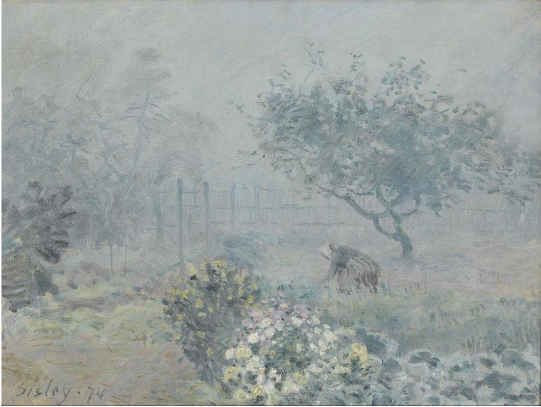
Görsel 9: Alfred Sisley, Sis, Voisins , 1874, tuval üzerine yağlıboya, 50,5 x 65 cm, Musée d'Orsay, Paris, Fransa.

Görsel 9'daki Sis isimli çalışma, Sisley'in atmosferik olayları gösterme yeteneğine örnektir. Gümüş rengi sisin tüm resim elemanlarını bağladığı bu eserde, biraz daha kalın boya kullanıldığı (Musée d'Orsay 1) belli olan çiçekler, ön plandadır. Bahçenin sınırını belirleyen çit, resmin sağ köşesinde kaybolma noktasındadır. Resmin ortasında eğilmiş, otları ayıklayan kadın figürü ve ağaçlar son derece rahat birkaç fırça darbesiyle yapılmıştır. Soyutlama sınırına gelmiş bu resim, sisin, ışığın nesnelere ulaşmasındaki bariyer olma özelliğini, masalsi havada vermiştir. Nemli havanın, puslu görünümü, açık pembe, mavi ve gri tonlarıyla oluşturulmuştur. Grinin tonlarının hâkim olduğu Sis, aynı zamanda sakin ve sessiz bir ortamı hissettirmektedir.