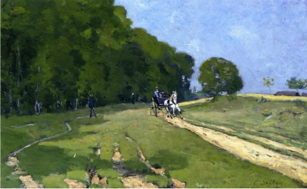
Görsel 1: Alfred Sisley, Courances Parkı'nın Yakınındaki Yol, 1868, tuval üzerine yağlıboya, 40x65 cm, özel koleksiyon.

Sisley'in yaptığı ilk peyzajlar Barbizon ekolü ressamlarının resimlerini çağrıştırmaktadır. Sisley'in Görsel 1'deki "Courances Parkının Yakınındaki Yol" isimli çalışması profesyonel resim hayatına başlamadan önceki dönemine ait bir çalışmadır. Resimdeki gölgelerden anlaşılacağı üzere, güneşli bir gündür. Resimde olgun kahverengi ve yeşil tonları kullanmıştır. Bu palet, empresyonistlere özgü canlı renk paletinden henüz uzaktır.