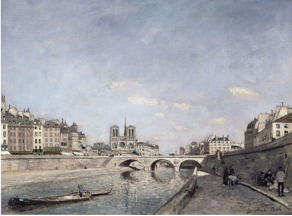
Görsel 10: Johan Barthold Jongkind, Paris'te Seine ve Notre-Dame, 1864, Tuval üzerine yağlıboya, 42 x 56,5 cm, Musée d'Orsay, Paris, Fransa.

nehirin ufuk çizgisinde kaybolan uzanışı ile tam da Sisley'in sevdiği peyzaj özelliklerine sahiptir.