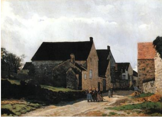
Görsel 2: Alfred Sisley, Marlotte Caddesi, 1866, tuval üzerine yağlıboya, 65 x 92 cm, Bridgestone Sanat Müzesi.