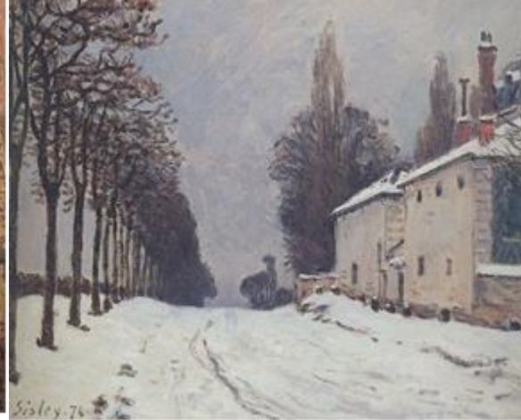
Görsel 7: Alfred Sisley, Yolda kar, Louveciennes, 1874, tuval üzerine yağlıboya, 38 x 56 cm, Özel koleksiyon.

Görsel 6'daki Sevres Yolu isimli resim, ağaçlardaki turuncu, sarı ve kahve tonlarına bakılırsa sonbaharın sıcak güneşli bir gününde resmedilmiştir. Hafifçe sağa kıvrılan yol izleyicinin gözünü gökyüzüne, gökyüzünden ağaçlara ve ağaçlardan sağa sollu binalara yönlendirir. Simetrik ve tek kaçış noktalı resmin kompozisyonu, renk ve dokuların işlenişleriyle önemsizleşmiştir. Tuval üzerine boyanın, ritmik ve kısa fırça darbeleriyle sürülmesi anlık görüntünün hareketini hissettirmiştir. Ağaçların ve evlerin dikey yönünü dengeleyen gölgeler ve ufuk çizgisi; ufuk çizgisine ulaşan diyagonal hatların oluşturduğu denge, ressamın şövaletini Sevres yolunun resimdeki noktasına koyma sebebi olarak görülmektedir.