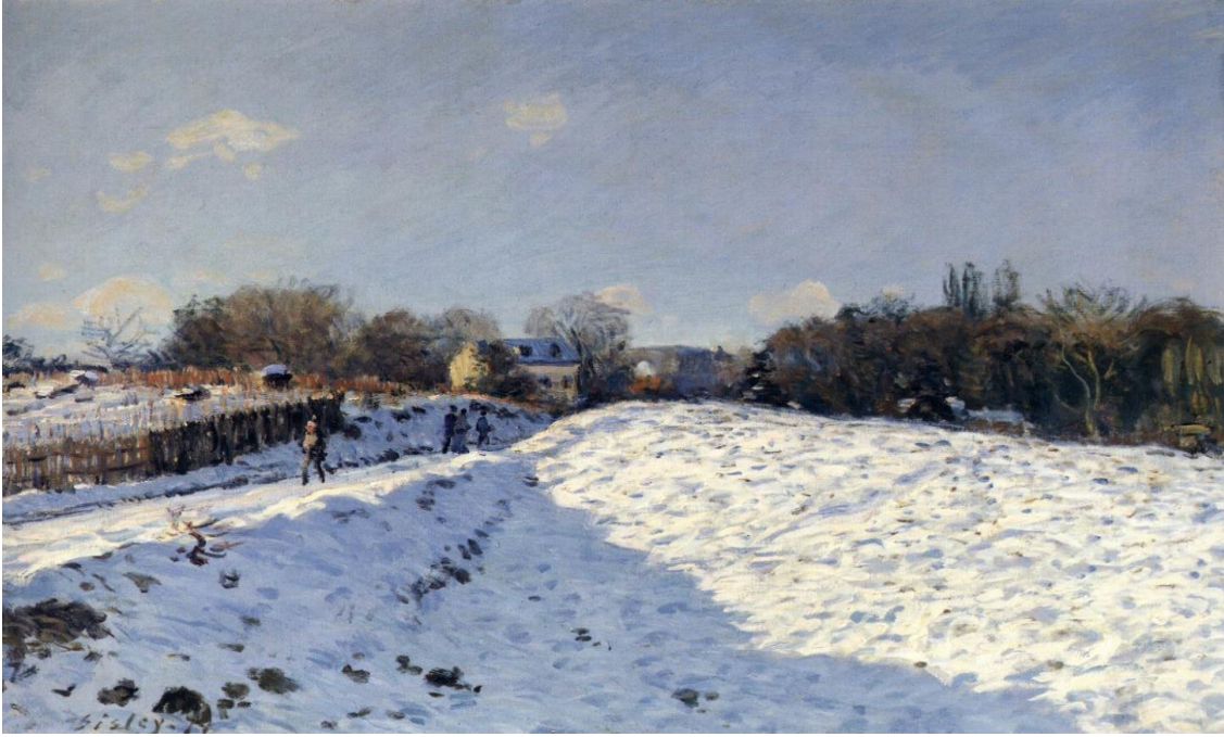
Görsel 8: Alfred Sisley, Argenteuil'de Kar Etkisi, 1874, tuval üzerine yağlıboya, 54 x 65 cm, Özel koleksiyon

Sisley'in Argenteuil'de Kar Etkisi isimli resmi için tuvalini koyduğu nokta, klasik Sisley manzara kadraji seçimlerindedir. Ancak klasik olmayan Sisley'in soğuk renkler arasında resmin üst tarafında, gökyüzünün ufuk çizgisinde bittiği yerde solda çitlerle başlayan, sağda ağaçların üzerindeki turuncu, kırmızı ve kahve tonlarını, melodik bir bestenin vurucu üst notaları gibi serpiştirmiş olmasıdır. Karda yürüyen en soldaki figürün turuncu bir leke şeklinde verilen yüzü bile resimden kaldırılırsa, resmin büyüğü kaçacak gibidir. Renklerin dağılımındaki bu hassas denge, ressamın sanatsal sezgisiyle sağlanmış olmalıdır.