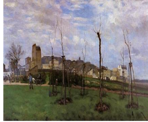
Görsel 3: Alfred Sisley, Montmartre'den Görünüm, 1869, tuval üzerine yağlıboya, 70 x 117 cm, Grenoble Müzesi, Grenoble, Fransa.

Görsel 2'deki Marlotte Caddesi ve görsel 3'deki Montmartre'den Görünüm isimli resimlerde renk olarak kahve tonları yine ağırlıktadır. Başlangıçtan itibaren Sisley'in kompozisyonlarındaki denge ve kurgu başarılı; paleti armoniktir. Teknik olarak klasik üsluba tamamen hakimdir. Sisley'in aldığı sanat eğitiminin çok kısa süreli oluşu göz önünde bulundurulduğunda görsel 1- 2- 3'te de görüleceği gibi sanatçının yeteneğinin çapının oldukça geniş olduğu anlaşılacaktır.