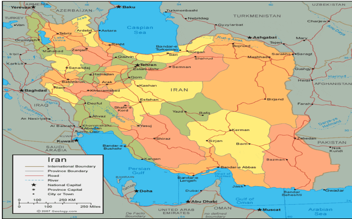
Şekil 1. İran'ın coğrafi konumu.

Şekil 1'de görüldüğü üzere İran, güneyde Basra Körfezi ve Umman Denizi, Kuzeyde ise Hazar Denizi ile çevrilidir. Türkiye, Azerbaycan, Ermenistan, Irak, Pakistan, Afganistan ve Türkmenistan ile kara sınırına sahiptir. İran, M.Ö. 4000'lere dayanan tarihi, köklü devlet geleneğine ve zengin bir kültür dokusuna sahip önemli bir bölge ülkesidir. Tarih boyunca İran Avrasya'daki merkezi konumu nedeniyle jeostratejik öneme sahip olmuştur ve bir bölgesel güçtür. Bugünkü İran topraklarına kurulmuş ilk büyük uygarlık Perslere aittir. Perslerin M.Ö.2800 yıllarında İran'a yerleştikleri tahmin edilmektedir. İran'da sırasıyla Sulukiler, Partlar, Sasaniler, Al-i Buveyh, Gazneliler, Selçuklular, Harzemşahlar, İlhanlılar, Muzafferiler, Timurlular, Türkmenler, Safeviler, Afşariler, Zendiler, Kaçarlar, ve Pehlevi hanedanı hüküm sürmüşlerdir (Tahran Ticaret Müşavirliği, 2015).