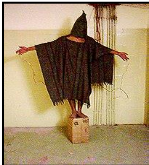
صور رقمية ذات خطاب بصري التقطت بكاميرا الهاتف الخليوي

فالصورة الرقمية تشكل وحدة مهمة في عوالم الاتصال البصري الإلكتروني ومن اهم وسائله وترى الباحثة ان الصورة تتميز بوظائف منها: